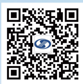
江苏省互联网协会