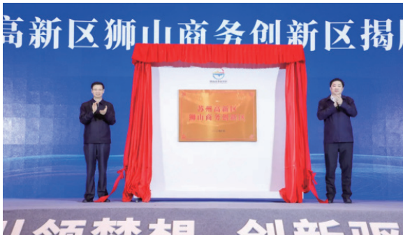
江苏省委常委、苏州市委书记许昆林，江苏省商务厅厅长赵建军为狮山商务创新区揭牌

11月28日，苏州高新区狮山商务创新区正式挂牌。江苏省委常委、苏州市委书记许昆林，江苏省商务厅厅长赵建军出席仪式，并为狮山商务创新区揭牌。苏州市委副书记、市长李亚平，省发改委副主任唐晓东共同为狮山金融服务业集聚区进行了授牌。